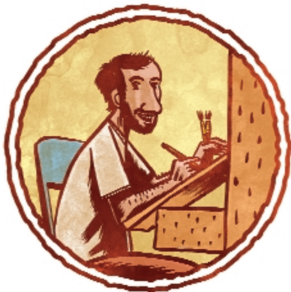
Ilustración y diseño de las portadas del DVD El nunca o faría , (productoras Faro y Ardora Filmes) y del DVD La petite mort (Ardora Filmes).

Portada y contraportada de Esa cousiña negra que levas no peito , de Kike Benlloch, para Editorial Polaçia.