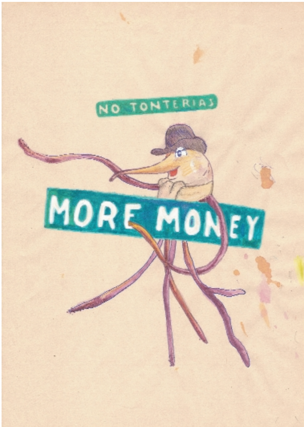
More Money (No tonterías) . 2003 Técnica mixta sobre papel. 29,7 x 21 cm.