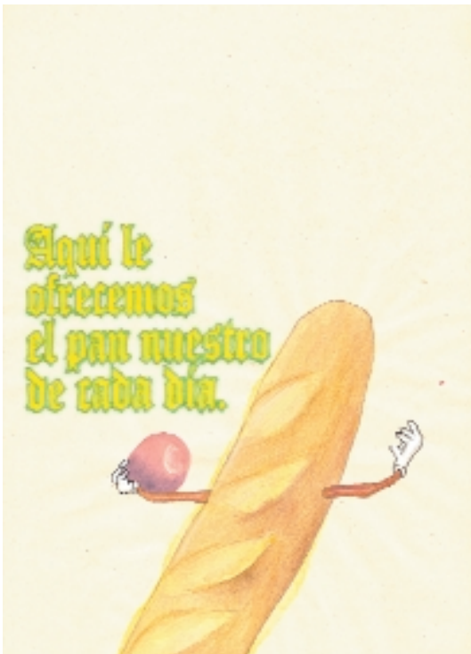
Aquí le ofrecemos el pan nuestro de cada día. 2005 Técnica mixta sobre papel. 29,7 x 21 cm.