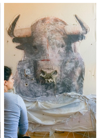
Gimena Romero, fragmento de El Rodeo . Técnica mixta.