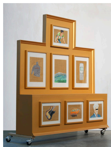
Retablo, Carlos Aquilué.