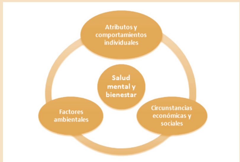
Figura 1. Determinantes de salud mental y bienestar

Es importante destacar que estos determinantes interactúan entre sí de una manera dinámica, y que pueden trabajar a favor o en contra del estado de salud mental de un individuo en particular. De esta manera pueden ejercer una función protectora (factores de protección) para el desarrollo y mantenimiento de la salud mental de la persona, o pueden constituir un riesgo para la misma (factores de riesgo).