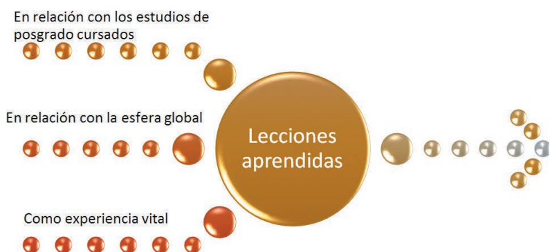
Figura 2.- Lecciones aprendidas en el proyecto Encuentro Internacional de Jóvenes para la simulación de una reunión del G20 -Diálogo, visión y participación activa de jóvenes sobre prioridades del G20 en materia de políticas públicas de juventud-

En relación con los estudios de posgrado cursados , ha sido una forma innovadora de poner en práctica, durante las diferentes fases del proyecto, la metodología docente de las diferentes asignaturas del máster; el proyecto ha permitido obtener una perspectiva amplia, real, profunda y práctica de la comunicación persuasiva, la co-orientación y las relaciones institucionales; aplicar el modelo de co-orientación con los participantes en