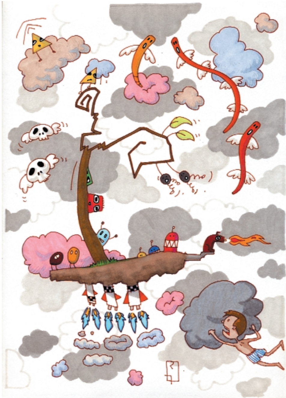
Gregor Samsa no soñaba así. 29,4 x 20,7 cm. Rotuladores.