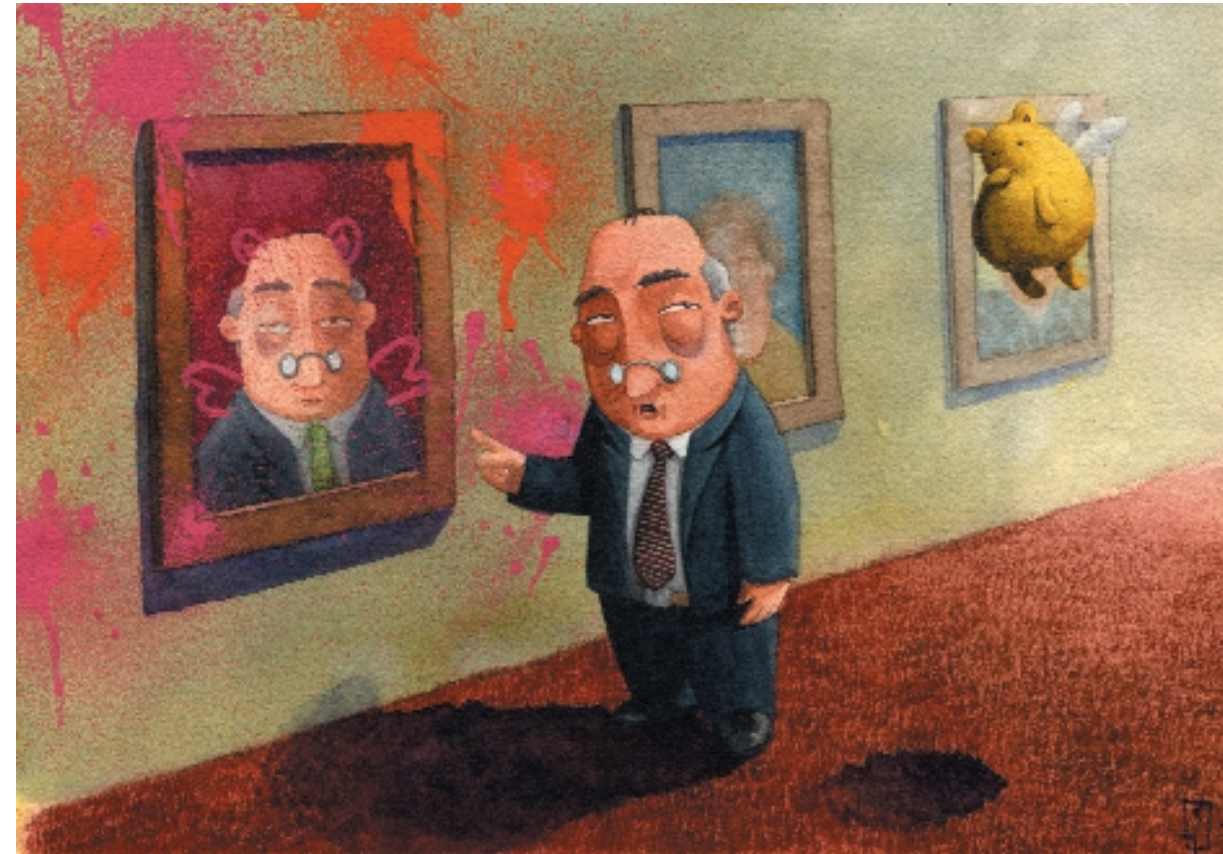
El Sr. Gruesocuello reprende a Tocinín. 24,5 x 34 cm. Acuarela y gouache.