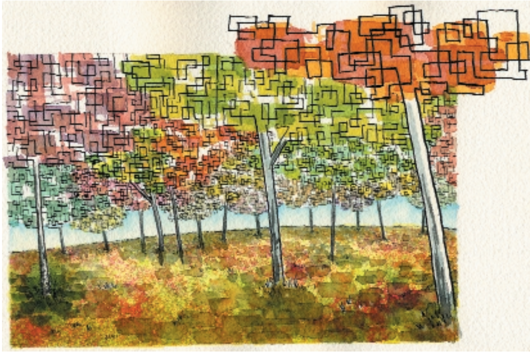
El bosque ortogonal donde jugábamos por las tardes. 13,7 x 21,2 cm. Acuarela y tinta china.