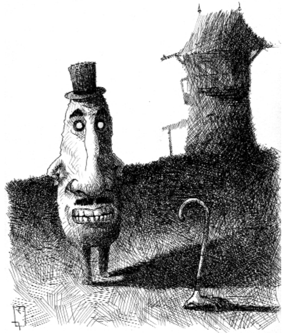
El díscolo bastón del Sr. Disgusto. 21 x 15 cm. Rotulador punta fina negro.