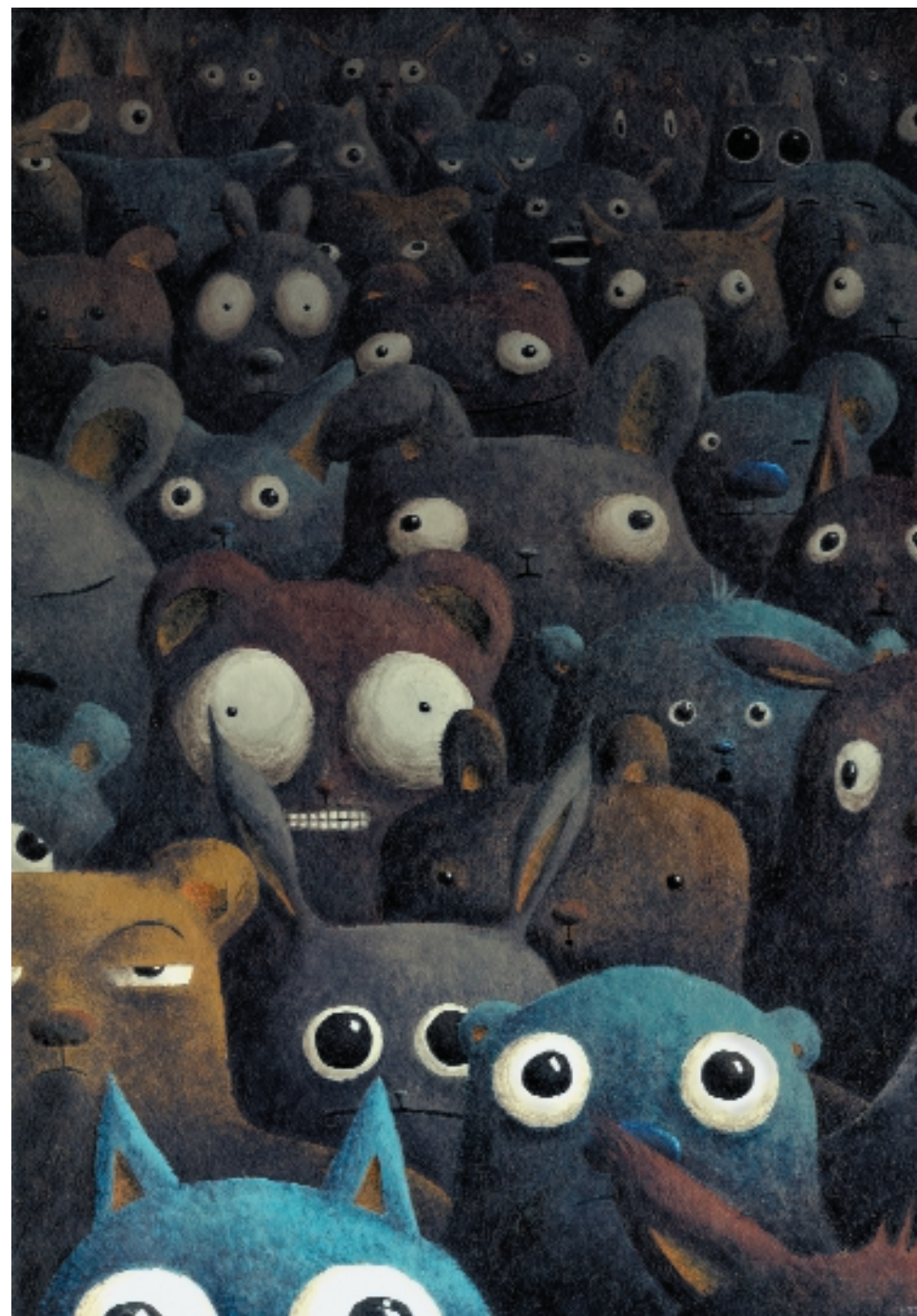
Público difícil. 49 x 34 cm. Acrílico y Photoshop.