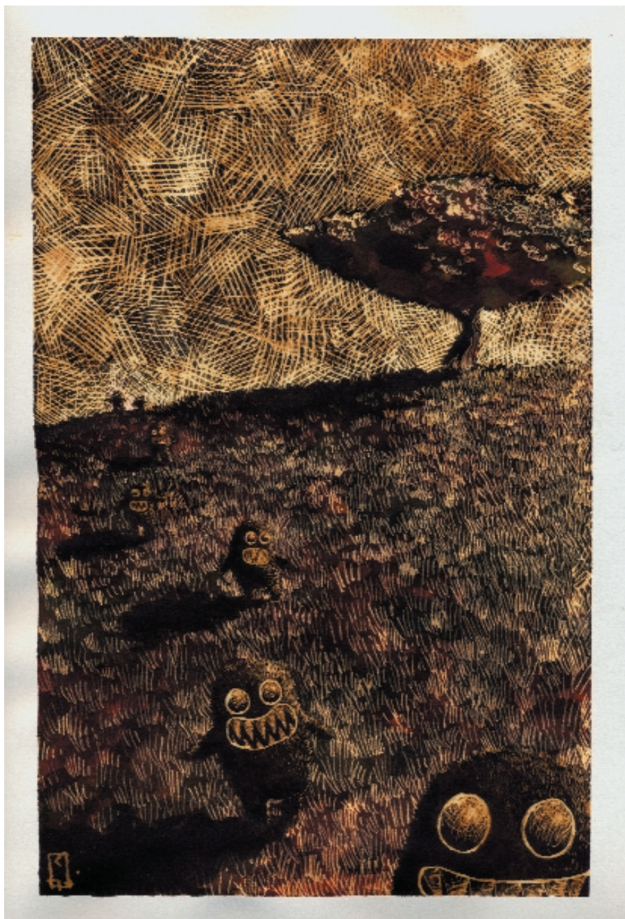
Estos son los invitados al picnic. 27,4 x 17,5 cm. Tintas y lejía.