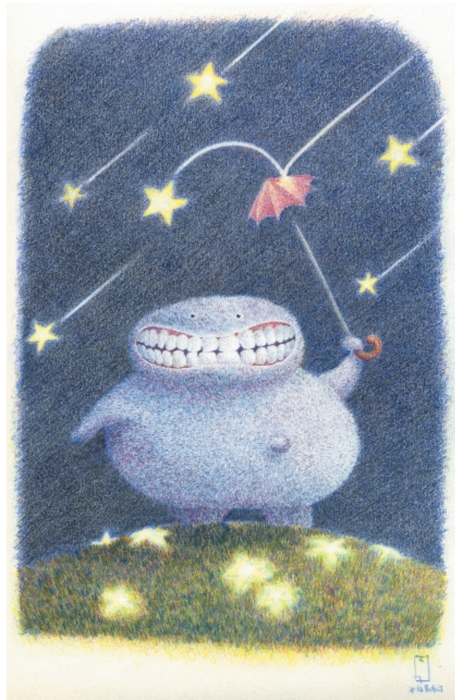
A Desmondo le gustan las estrellas (al vapor). 25 x 17 cm. Lápices de colores.