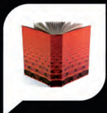
Textos teatrales Marqués de Bredomín