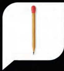
Cómic e Ilustración