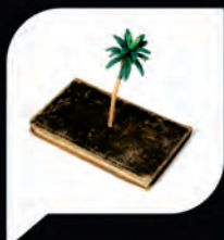
Narrativa y Poesía