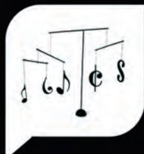
Composición de Música Contemporánea