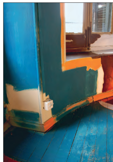
Miren Doiz Sin Título

El espacio urbano es inmensamente atractivo; dentro de esa eterna búsqueda de control y civilización, siempre podemos encontrar a cada paso las improntas de los gestos de otros, pequeñas acciones rebeldes que torsionan el espacio hacia lo caótico, lo sucio o lo abandonado.