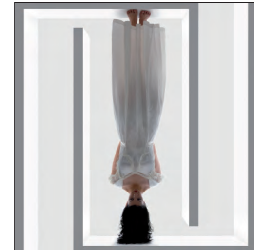
Isabel Tallos Encriptadas

..... [Sobre mi trabajo] El ejercicio de escribir sobre mi trabajo me resulta demasiado agotador más aún cuando otros ya han puesto letras a lo que pienso.