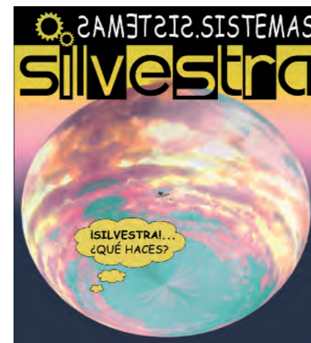
Arantazu Tomás Sistemas

Una de las escenas más sublimes de la película "El espejo" de Andrei Tarkovsky nos presenta a una mujer esperando la llegada de su marido. Cuentan que durante el rodaje, la actriz no conocía el desenlace de la escena, ella tenía que esperar, simplemente esperar.