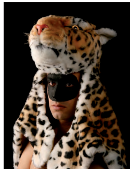
Oriol Nogues Autoretrato

En estos mini-relatos pictóricos trato de retener la huella de apenas un momento, una persona, una canción concreta. Ésto supone idear un tiempo metafísico donde el "instante fotográfico" quede liberado de su dependencia a unas fracciones de segundo.