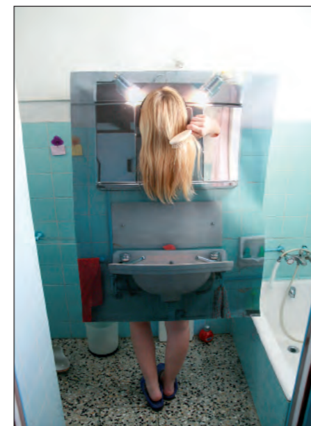
Ariadna Parreu Gerundios domésticos

Video a partir de la canción "flashback al revés" de Klaus & Kinski. Hecho con 1800 fotografías, 7 cartuchos de tinta y mucha paciencia.