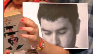
Chema García Flashback al revés

Las líneas estructuran de forma orgánica el vacío del papel, hasta crear un espacio autónomo en el que se inscribe la información. Cada dibujo sintetiza, en una representación codificada y concreta al mismo tiempo, un concepto o reflexión abiertos a la interpretación, pero dirigidos intencionadamente por el autor.